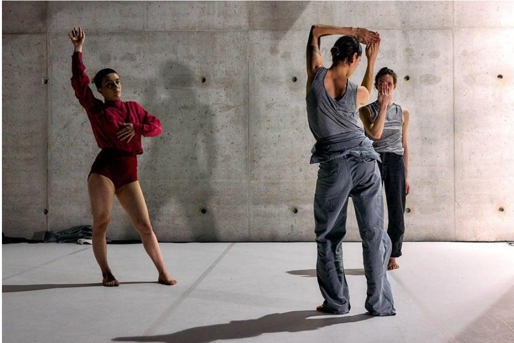
'Beyond the black box' brengt een mix van verschillende kunstdisciplines.

Zo kan u in de straten rondom theaterhuis Monty, in de Montignystraat 3 op het Antwerpse Zuid, een wandeling meedoen, of een danseres 'achtervolgen' in de volkse wijk Seefhoek. "Het publiek wordt mee uitgenodigd tussen de woonblokken, die in de toekomst trouwens zullen worden afgebroken", vertelt Janssens. "Kunstenares en choreografe Kinga Jaczewska zorgt voor een dansperformance in een bijzondere setting van brutalistische architectuur."