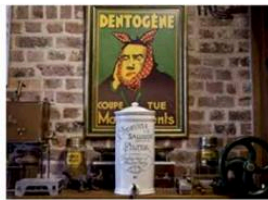
Apothekerscollectie in Houtem.