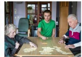
'Tovertafel' in Berchem.