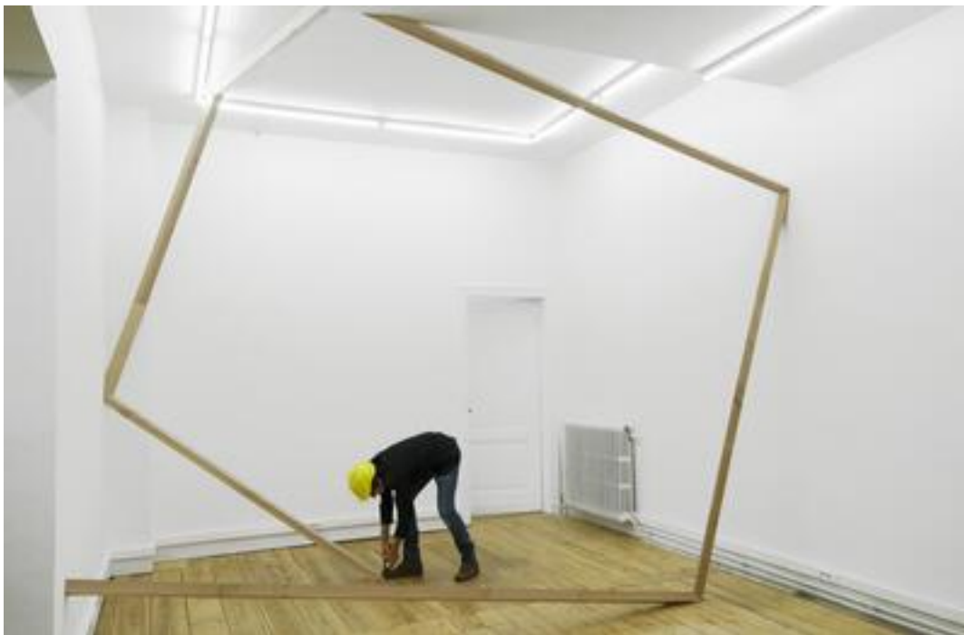
One Nail, 2015 Installation and performance at Marion de Cannière, Antwerp

op het dak van een parkeergarage. 'Plus près de Toi' is een trapje over een muur dat leidt naar een hangbrug. Al glijdend naar beneden bereik je het eindpunt, wat een uitzicht biedt over de omgeving. Een eerste hangbrug bouwde Tirtiaux in Sint-Niklaas voor Coup de Ville in 2013 met als thema 'Attracted by another Level'. De houten constructie op acht meter hoogte hangt aan een schoolgebouw en reikt net niet tot aan het gebouw aan de overkant van de straat. Deze brug is een metafoor voor onderweg zijn. Dat begint breed met veel verwachtingen, versmalt naar het einde toe omdat moeilijkheden opduiken en compromissen moeten gesloten worden om een doel te bereiken. In 2020 wordt zijn droom om een permanente brug te bouwen werkelijkheid. Deze voetgangersbrug verbindt de site Transfo en het Kanaal Bossuit-Kortrijk. Deze industriële site heeft sinds 2004 een socioculturele invulling maar was moeilijk bereikbaar. De brug zelf bestaat uit een doorlaatbare houten structuur die aan betonnen balk hangt. De titel 'Top Down Bottom Up' verwijst naar de betonnen drager bovenaan en de wilde platen die vanuit de put door de houten constructie kunnen groeien.