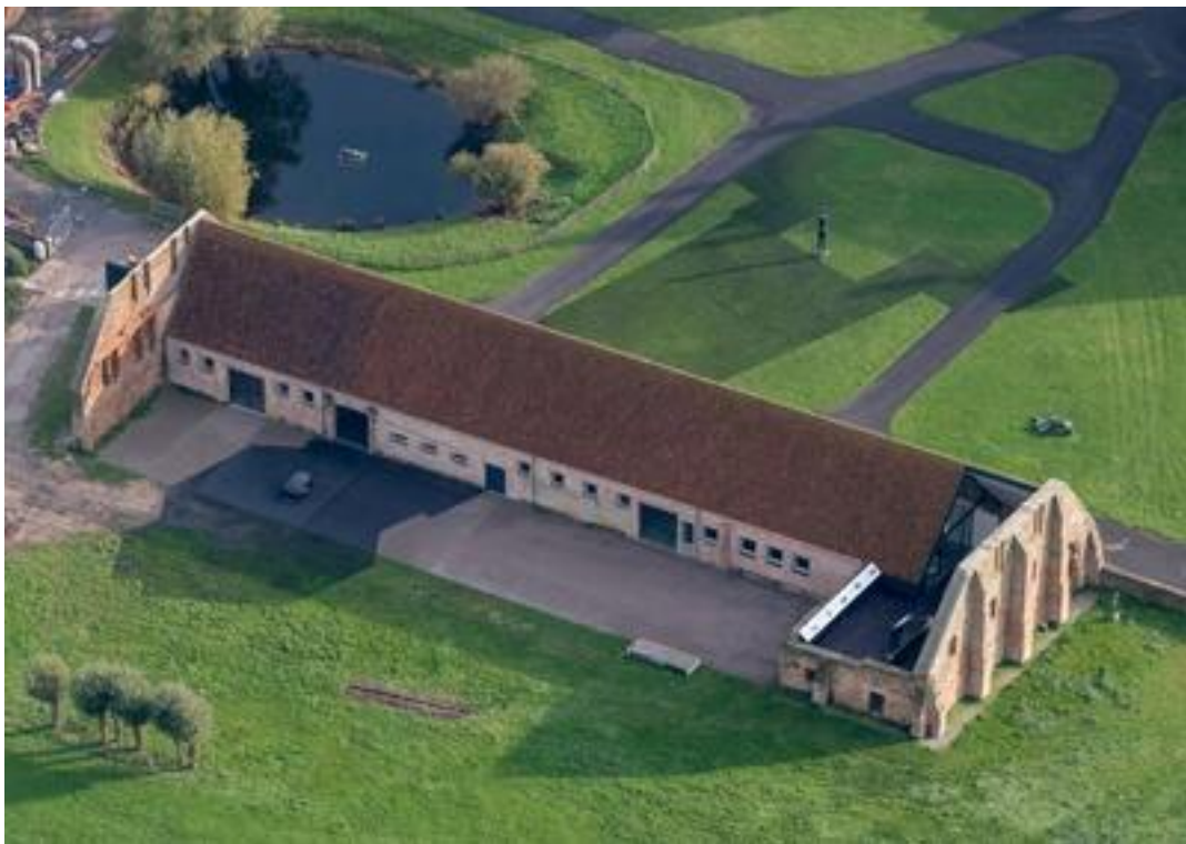
Regardant le soleil, 2019 Intervention at Kunstencentrum Ten Bogaerde, Koksijde