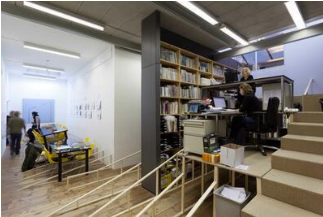
The Great Cut, 2012 Intervention at Stroom Den Haag