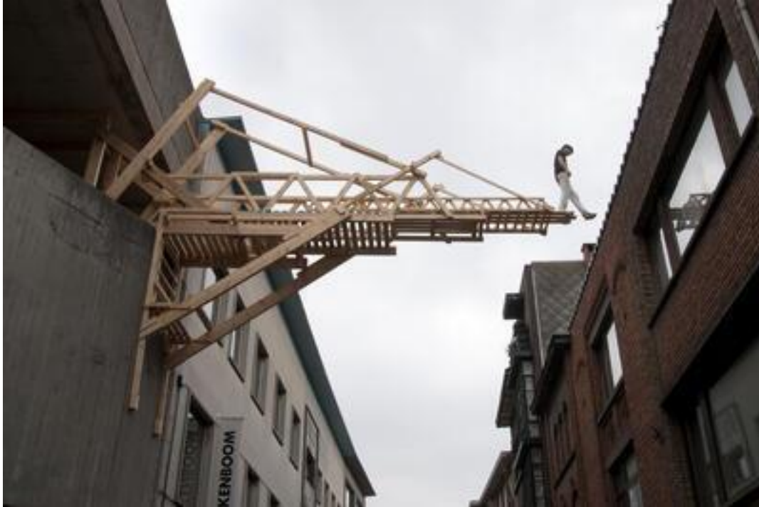
Bruggen bouwen, 2013 Intervention for Coup de Ville, Berkenboom school