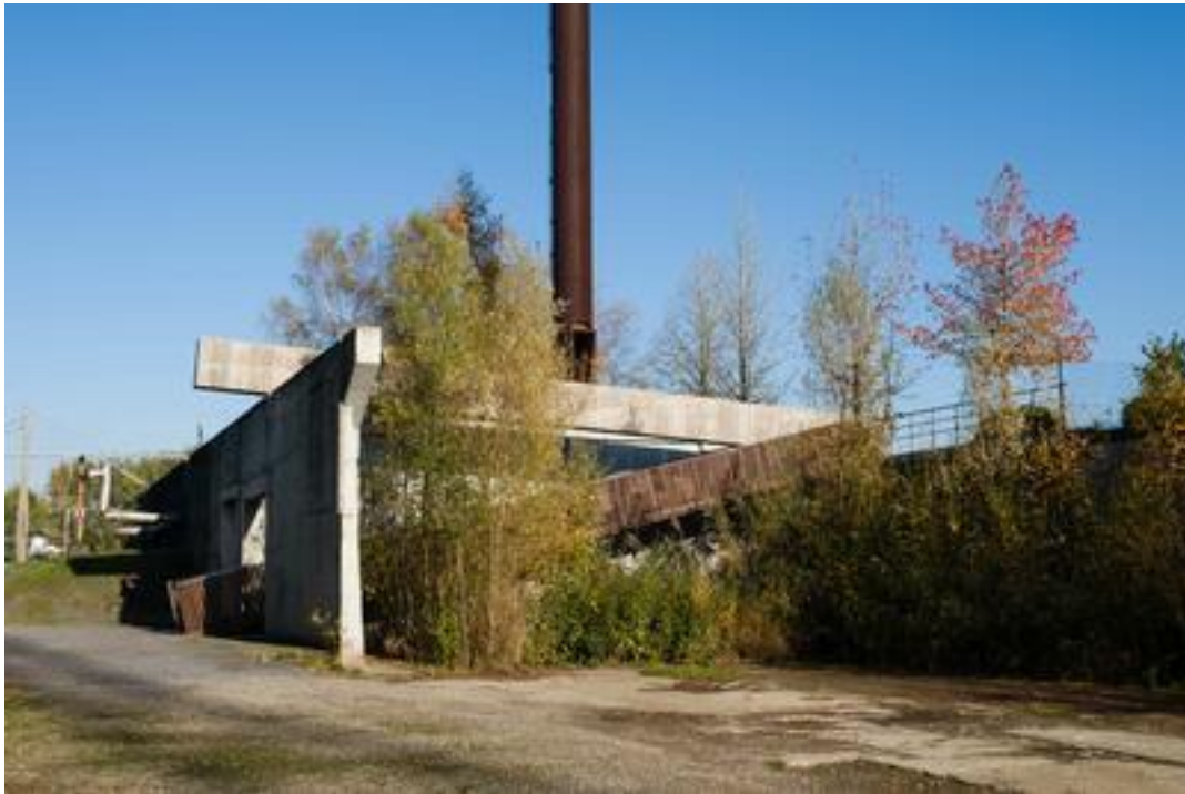
Top Down Bottom Up, 2020 Permanent footbridge for Contrei Live, Transfo Zwevegem