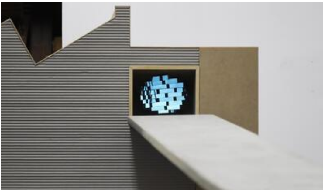
Ciel de Bruxelles (recyclé), 2018-2021 Model of artistic integration for Recy-K, Brussels