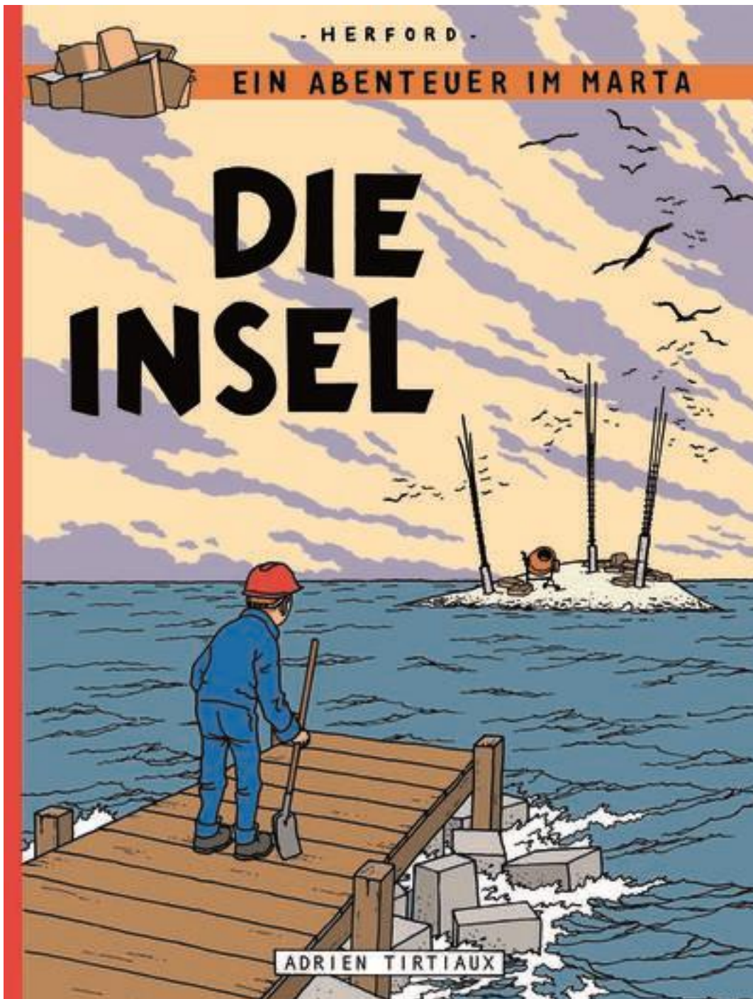
Die Insel im Marta (I), 2020 Introductory poster for educational project at Marta Herford

schroefvormige patronen. Spelenderwijs zaken ontdekken en begrijpen, geven hem inzicht in het bouwen van grotere constructies. Hoe groot het project ook is, Tirtiaux wil de manier waarop het gebouwd wordt zelf in handen hebben.